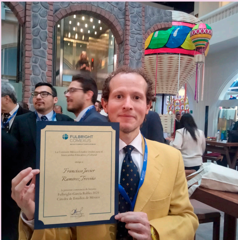
Fotografía de las autoras.